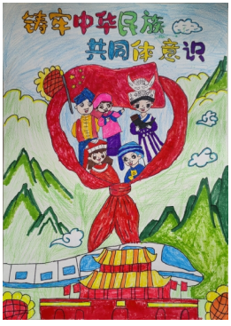
《五十六颗心,一个家》