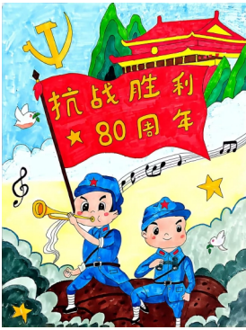
《九三阅兵》作者:兰溪金厦 宋张颖